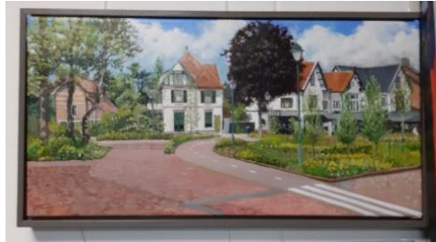
Het Vinkenplein in Bilthoven.

De lijstenmaker aan de Herenstraat in De Bilt heeft ze gevraagd om model te staan. Hij is duidelijk te zien. Ook heeft ze een studie gemaakt van het schilderen van de juiste kleding, de gevels en het bootje. Voor Vermeer is licht van groot belang en daarin voelt zij zich verwant met het letten op de inval van licht, donker en de schaduw.